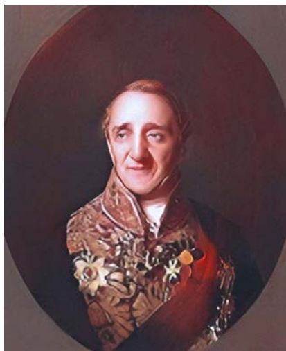
Христофор Екимович Лазарев