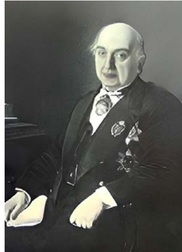
Иван Давыдович Делянов