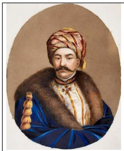
Манук-бей Мирзаян. Портрет кисти неизвестного автора.

Манук-бей Мирзаян, крупный бизнесмен, финансист, драгоман и посредник по европейским делам при султанах Османской Порты, переехал в Бессарабию в 1816 году. В 1810 г. он был награжден Указом Александра I орденом Св. Владимира, а в 1814 г. – чином Действительного Статского Советника.