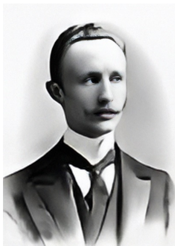
Барон Маврикий Фабианович Шиллинг

М.Ф. Шиллинга, который отражает его деятельность как дипломата, его литературную и научную работу. 1